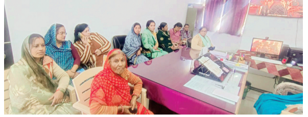
हरिभूमि न्यूज | नलखेड़ा

मुख्यमंत्री डॉ. मोहन यादव ने मंगलवार को छतरपुर के राजनगर में आयोजित लाइली बहना सम्मेलन में प्रदेश की 1.26 करोड़ से अधिक लाइली बहनों को 1857 करोड़ रुपए राशि अंतरित की गई है। इनमें आगर-मालवा जिले की 1 लाख 17 हजार 256 हितग्राही लाइली बहनें शामिल हैं। जिले की हितग्राही बहनों को 17 करोड़ 23 लाख 29 हजार 300 रुपए की राशि उनके बैंक खातों में मिलेगी।